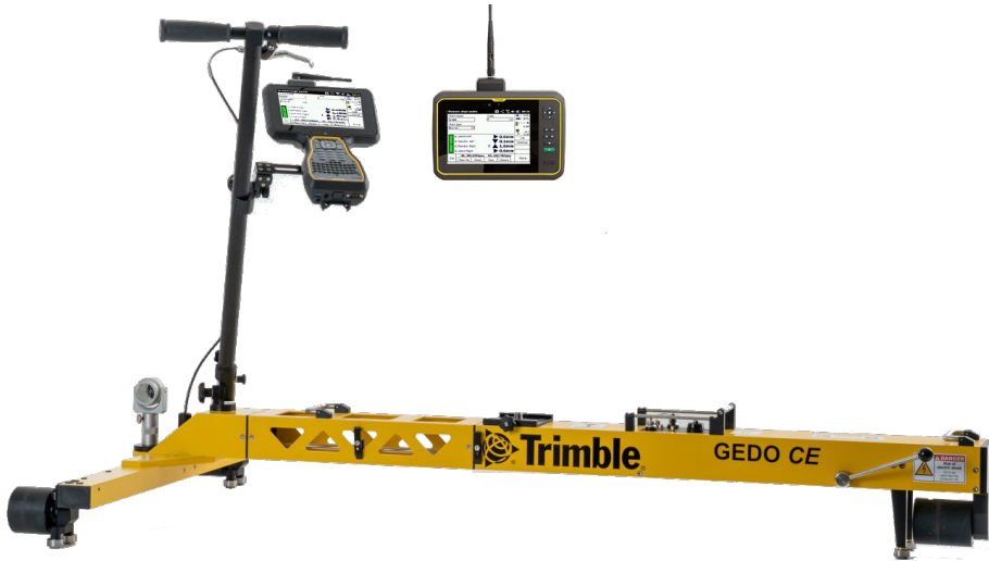
Spezifikationen können jederzeit ohne vorherige Ankündigung geändert werden.